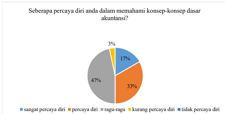
Gambar 1 Data Pra-riset Self Efficacy

Selain itu, peneliti juga melakukan pra-riset terlebih dahulu untuk mengetahui apakah para mahasiswa memiliki self-efficacy yang baik atau tidak dalam proses belajar mengajar dalam lingkup jurusan pendidikan akuntansi. Pra-riset ini dilakukan kepada 30 mahasiswa jurusan pendidikan akuntansi Universitas Negeri Jakarta. Hasil dari kuesioner yang dapat didapatkan oleh peneliti adalah sebagai berikut: