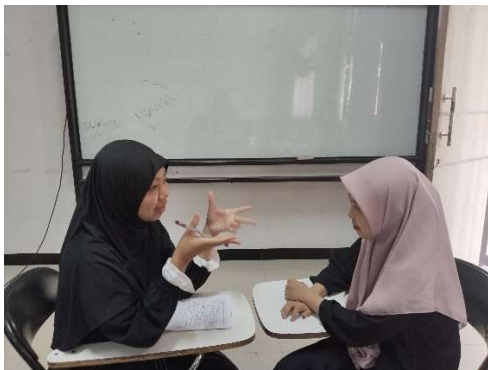
Gambar 1.5 wawancara

Berdasarkan data hasil wawancara dan dokumentasi yang telah diperoleh dari individu mengatakan bahwa kutipan positif dapat menguatkan regulasi emosi seperti pernyataan berikut: “Pas lagi jatuh banget, kutipan positif itu ibaratnya jadi penyelamat. Dulu aku pernah hampir nyerah ngejar impian. Tapi setelah baca kutipan yang nyentuh banget, aku pelan-pelan bangkit dan jadi berani buat lanjut lagi. Kecil sih, tapi efeknya besar banget”.