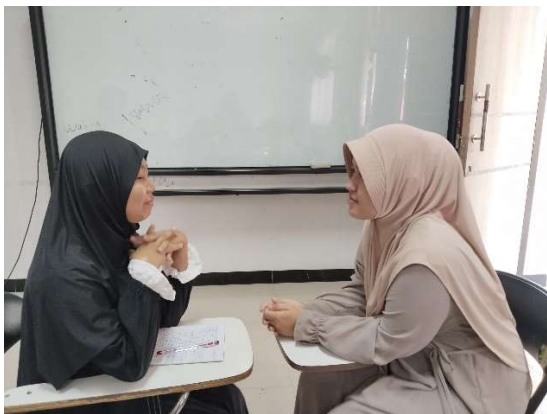
Gambar 1.3 wawancara

Berdasarkan data hasil wawancara dan dokumentasi yang telah diperoleh dari individu mengatakan bahwa kutipan positif dapat mendorong refleksi diri dan reframing pikiran seperti pernyataan berikut: “Kutipan yang paling bikin semangat menurutku itu yang bilang kalau kita nggak sendirian dan semua orang punya masalah. Kayak “semua orang pernah gagal, tapi yang penting jangan berhenti.” Itu bikin aku merasa lebih tenang dan terus mau berusaha”.