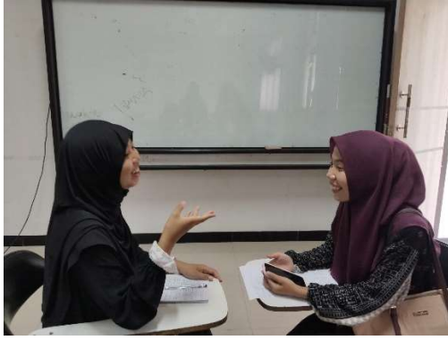
Gambar 1.6 wawancara