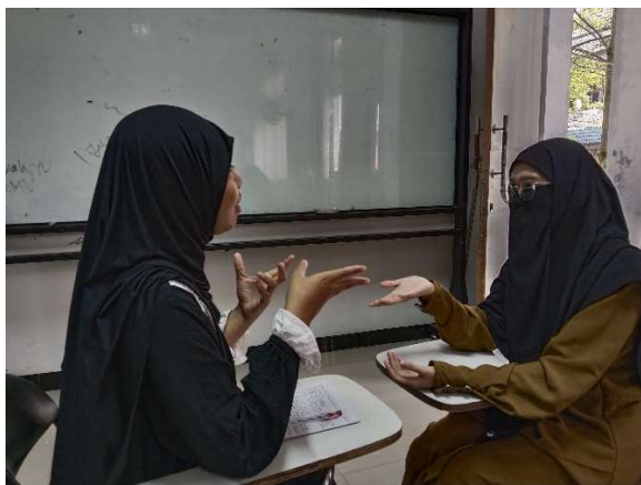
Gambar 1.2 wawancara

Kemudian ada juga pernyataan: “Pernah banget. Waktu hati lagi down dan semangat udah kayak hilang arah, aku scrolling sosmed dan nemu kutipan yang langsung bikin hati adem. Rasanya kayak diingetin lagi buat nggak nyerah sama tujuan hidup”.