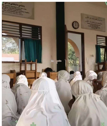
Gambar 1 Siswa melaksanakan shalat dhuha

Seperti yang sudah dijelaskan diatas bahwa shalat dhuha berjamaah biasanya dilakukan sebelum KBM dimulai yaitu sekitar pukul 06.45-06.55. Hal ini memastikan