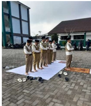
Gambar 2 Sanksi bagi siswa yang terlambat mengikuti shalat dhuha berjamaah

Nilai disiplin dan tanggungjawab ditanamkan melalui mekanisme kehadiran siswa yang wajib dan tepat waktu pada pukul 06.45 untuk melaksanakan shalat dhuha berjamaah di masjid ataupun aula. Melalui hal tersebut, siswa dilatih untuk mengelola waktu secara mandiri antara mandi, sarapan, dan menyegerakan diri ke masjid ataupun aula. Pengawasan ketat melalui presensi dan pendampingan asatidz menekankan bahwa shalat dhuha berjamaah di SMP Al Madina adalah tanggung jawab individu yang harus dipenuhi secara konsisten. Praktik tersebut melatih pengendalian diri dan tanggung jawab siswa dan membentuk kepribadian siswa yang disiplin dan menghargai waktu. Jika siswa tidak mengikuti dan melakukan shalat dhuha berjamaah, nantinya akan ada sanksi yang diberikan oleh guru BK sebagai tanggungjawab yang harus dilaksanakan siswa tersebut. Oleh karena itu, Kepala Sekolah mengemukakan bahwa studi kasus serupa menunjukkan adanya penurunan pelanggaran disiplin setelah pembiasaan shalat dhuha, karena siswa terbiasa dengan disiplin waktu dan tanggung jawab.