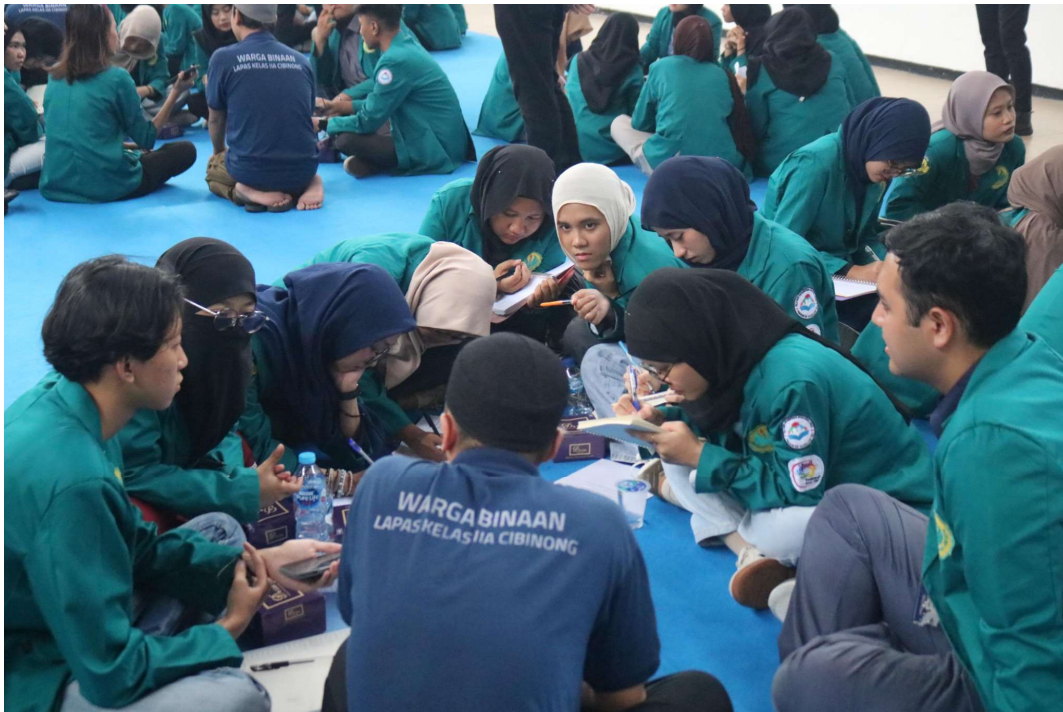
Gambar 1.1 Dokumentasi Langsung saat Wawancara dan Observasi

Strain yang dialami para narapidana tidak hanya berasal dari persoalan yang mereka hadapi sebelum melakukan tindak kejahatan. Tekanan tersebut juga terbentuk secara bertahap melalui pengalaman hidup di lingkungan keluarga maupun masyarakat. Dalam kerangka General Strain Theory, lemahnya kontrol sosial misalnya ketiadaan figur pendukung atau tempat untuk meminta bantuan membuat individu semakin sulit mengelola tekanan dengan cara-cara yang adaptif. Kondisi ini memperburuk strain yang dirasakan karena individu menjalani kehidupan dengan rasa terisolasi dan tanpa penguatan norma yang konsisten. sebagian besar narapidana hidup dalam situasi sosial dan kondisi kerja yang tidak stabil sebelum melakukan pencurian. Banyak di antara mereka bekerja di sektor informal, seperti buruh harian, pekerja lepas, atau pengemudi transportasi daring, dengan pendapatan yang sangat bergantung pada dinamika pasar. Ketidakpastian pendapatan tersebut menciptakan chronic strain atau tekanan jangka panjang yang secara perlahan mengikis ketahanan psikologis individu. Agnew (2001) mengidentifikasi jenis strain ini sebagai salah satu bentuk tekanan yang paling berpotensi mendorong perilaku kriminal karena sifatnya yang berulang, sulit dikendalikan, dan sukar diselesaikan melalui strategi coping konvensional.