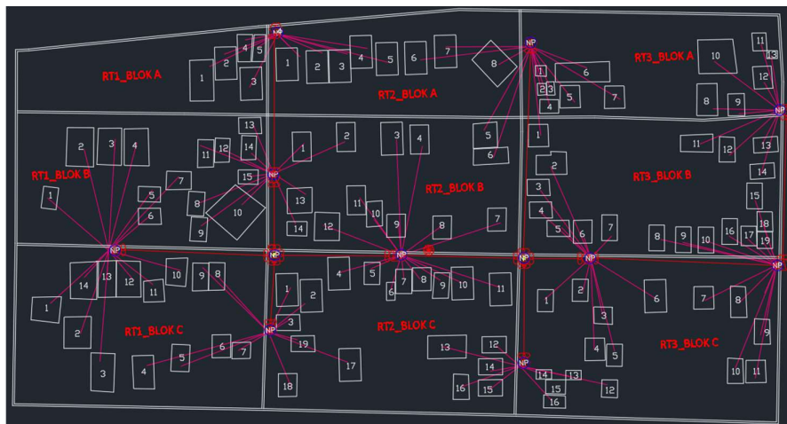
Gambar 2. Desain jaringan Skenario B