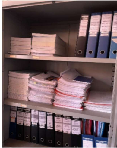
Gambar 2. Penyimpanan arsip yang kurang teratur